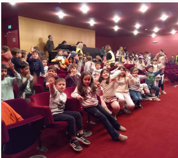
Grande Auditório do Teatro Tempo

No passado dia 13 de fevereiro, as turmas A e B da EB nº 5 foram ao Teatro TEMPO assistir à peça "A cigarra e a formiga".