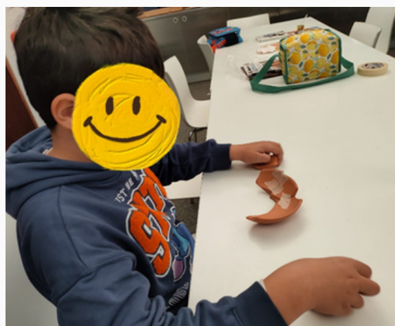
Reconstruindo peças de cerâmica

Quando chegaram ao Museu, os alunos foram organizados em cinco grupos. Cada grupo foi chamado para conhecer um pouco do trabalho de um arqueólogo e descobrir os vestígios de peças de cerâmica. Depois cada aluno reconstruiu a sua peça e desenhou-a.