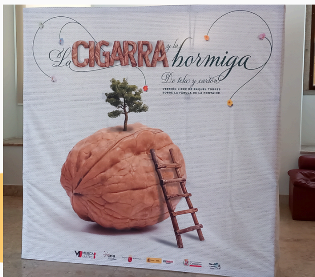
"A Cigarra e a Formiga"

Foi uma atuação muito cheia de luz e cor. Uma experiência de aprendizagem diferente e muito divertida!