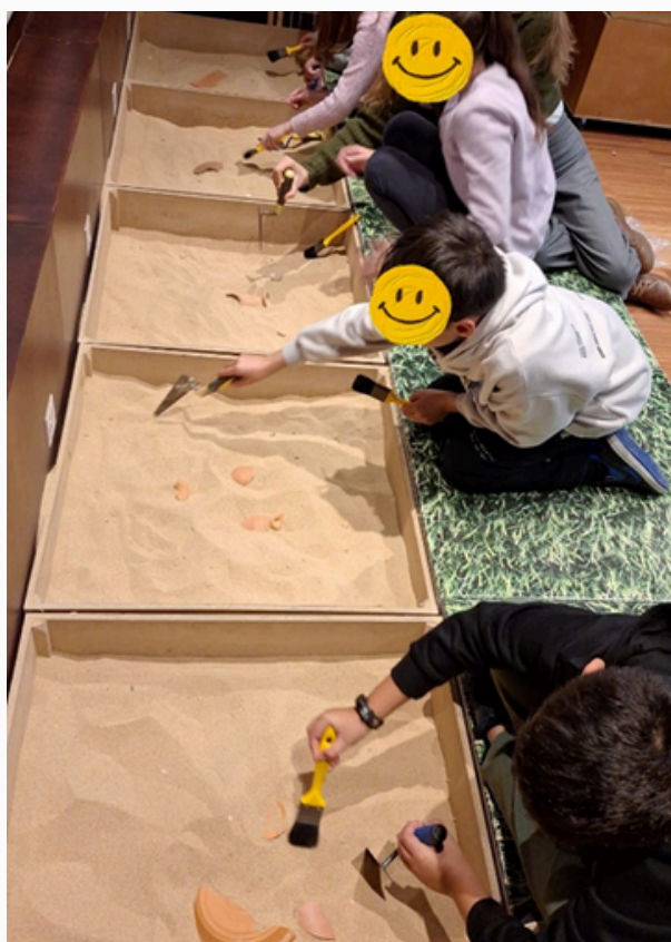
Descobrimos vestígios nas quadriculas de areia.

No mês de fevereiro, as quatro turmas do 3º ano do agrupamento foram ao Museu Municipal de Portimão, participar na oficina educativa de iniciação à arqueologia.