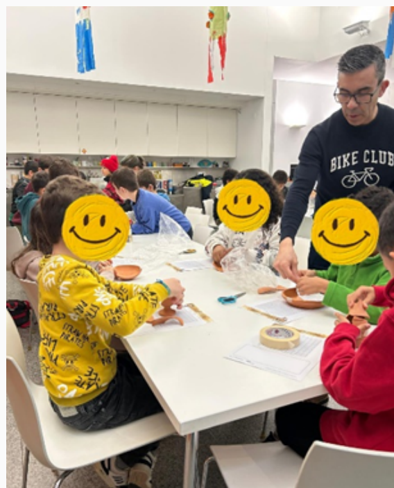
Desenhando as peças

Com esta atividade os alunos compreenderam como se faz uma escavação arqueológica. Segundo os alunos, foi uma atividade muito divertida e educativa.